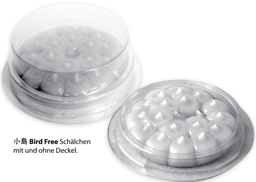
小島 Bird Free Schälchen mit und ohne Deckel.